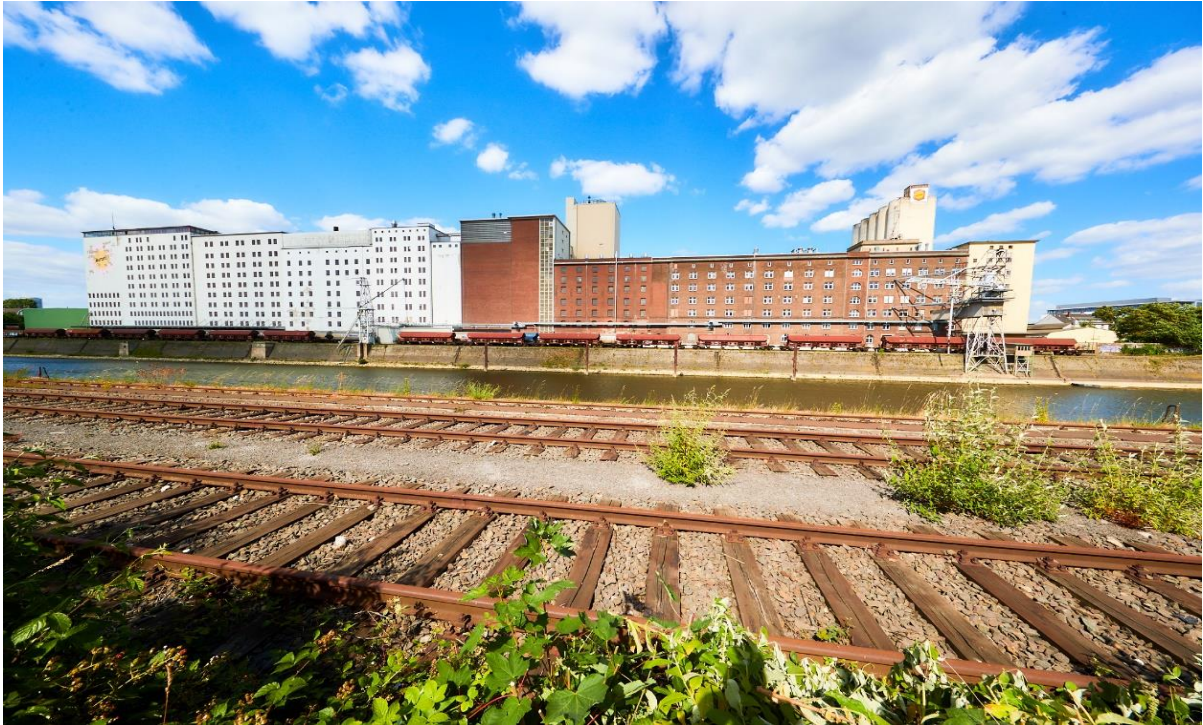
Eilmühle und Auermühle im Deutzer Hafen Köln

Köln, 11. Januar 2021 Die Stadtentwicklungsgesellschaft moderne stadt und der Stadtkonservator der Stadt Köln, Dr. Thomas Werner, haben sich zur Revitalisierung der Mühlen im Deutzer Hafen auf einen Kompromiss verständigt: Die Interessen des Denkmalschutzes am Erhalt der schützenswerten Bausubstanz und der für eine wirtschaftliche Nutzung der Immobilien erforderliche Gestaltungsspielraum wurden in Einklang gebracht. Auf Grundlage einer gemeinsamen Vereinbarung hat moderne stadt ihre im Jahr 2019 beim Verwaltungsgericht Köln eingereichte Klage gegen die vorangegangene Unterschutzstellung eines Großteils der Gebäudesubstanz zurücknehmen können. Der Stadtkonservator bestätigt: „Die denkmalrechtliche Zusicherung mit Blick auf den zukünftigen baulichen Umgang mit dem Mühlenensemble bietet eine verlässliche und konstruktive Grundlage für die kommenden Projektentwicklung.“